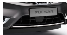
Eesmise pörkeraua iluliist, kroomitud