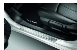
Lävepakukatted ja tekstiilmadid, veluurist (mustad)

*Soovituslik jaehind, ei sisalda paigaldust. Hinnad võivad muutuda, täpseima teave saamiseks palun pöörduge edasimüüja poole.