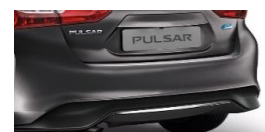
Tagumise pörkeraua iluliist, kroomitud