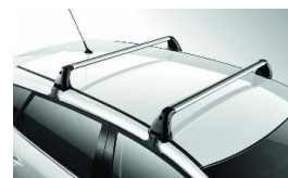
Katuseraamid, alumiiniumist, T-soon