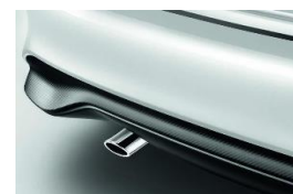
Summutiots (bensiin turbo, DIG-T190)