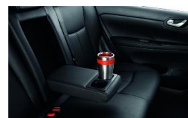
Tagumised topsihoidikud (2 istme käetoel)